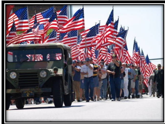
Desfile durante el Día de los Caídos (15 de mayo de 2012)